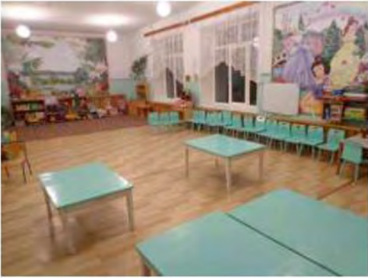
Φοτο Νο 7