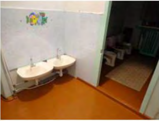
Φοτο Νο 10